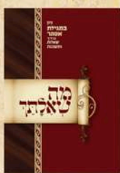
מה שאלתך מגילת אסתר