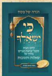
כי ישאלך עדות המזרח