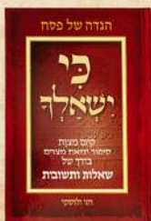
כי ישאלך אשכנז